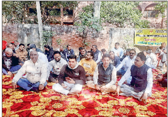
सोनीपत। लघु सचिवालय परिसर में धरना स्थल पर हड़ताल कर रोष जताते दी रेवेन्यू पटवार एवं कानूनगो एसोसिएशन के जिला पदाधिकारी व सदस्य।

दी रेवेन्यू पटवार एवं कानूनगो एसोसिएशन, हरियाणा के आह्वान पर जिला पदाधिकारियों व सदस्यों ने क्षतिपूर्ति पोर्टल पर फसल खराबा में गलत रिपोर्ट के मामले में निलंबित किए गए पटवारियों के समर्थन में लघु सचिवालय परिसर के धरना स्थल पर एक दिवसीय हड़ताल कर रोष जताया। पटवारियों व कानूनगो ने एकत्रित होकर धरना देकर सरकार को चेताया कि अगर निलंबित किए गए 6 पटवारियों को जल्द बहाल नहीं किया तो वह 2 फरवरी से नियमित रूप से हड़ताल करने के लिए मजबूर होंगे।