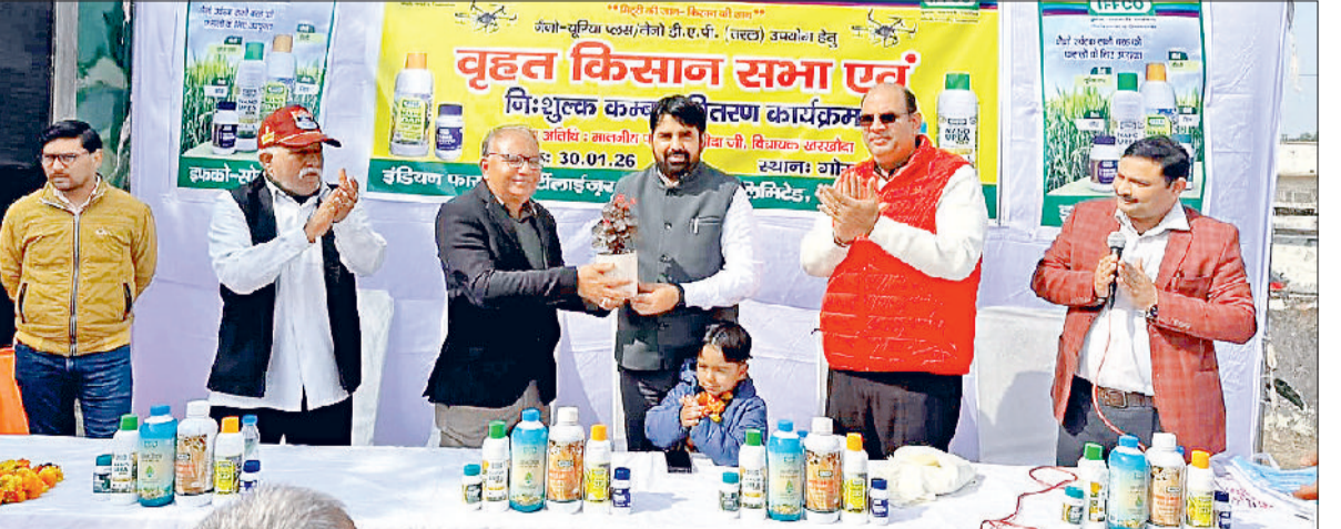
खरखोदा। विधायक पवन खरखोदा का स्वागत करते कृषि अधिकारी।

जीवन में केवल ईमानदारी से संघर्ष करना सीखा है हरिभूमि न्यूज खरखोदा