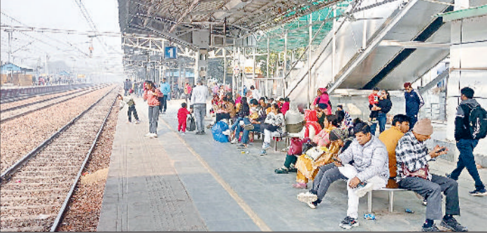
सोनीपत। स्टेशन पर ट्रेन का इंतजार करते यात्री।

जम्मू मेल एक्सप्रेस में सोनीपत स्टेशन से पंजाब व जम्मू कश्मीर जाने की बांट जोह रहे यात्रियों को अभी और इंतजार करना पड़ेगा। सूबेदारगंज से श्रीमाता वैष्णो देवी कटरा अप-डाउन रूट पर आवागमन करने वाली ट्रेन संख्या 20433/20434 जम्मू मेल एक्सप्रेस का परिचालन अब 31 मई तक अंबाला तक रहेगा। पहले यह ट्रेन 1 अप्रैल से श्रीमाता वैष्णो देवी कटरा तक चलनी थी। उत्तर रेलवे की ओर से कठुआ-माधोपुर, शहीद कैप्टन तुषार महाजन-चक्र रखवाल, पठानकोट-कंदरौरी स्टेशनों के बीच अपडाउन रूट पर निर्माण संबंधी कार्य करवाए जा रहे हैं। पुलों की मरम्मत व