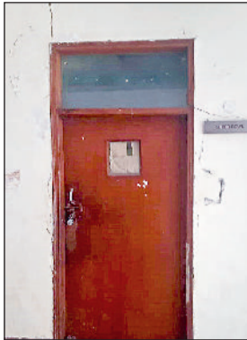
सोनीपत। पटवारखाना कार्यालय के दरवाजे पर लटका ताला।