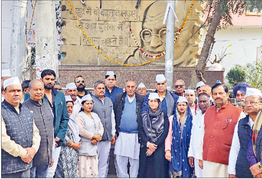
सोनीपत। गांधी चौक पर पहुंचे कांग्रेसी नेता एवं पदाधिकारी।

राष्ट्रपिता महात्मा गांधी के विचार आज भी प्रासंगिक : दिवान हरिभूमि न्यूज सोनीपत